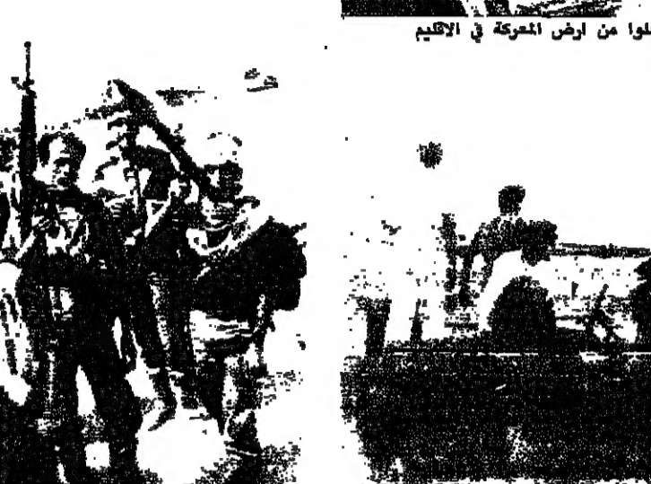
مقاتلون من «فتح» في عين الحلوة